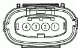
电动水泵 (EWP) 连接器